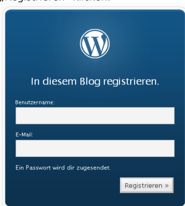
Abbildung 3: Einen Benutzer registrieren

Um sich zum Schreiben von Beiträgen anmelden zu können, muss man sich erstmal registrieren. Das geht über die URL http://blog.cvjm-nuernberg.de/wp-login.php?action=register oder über den Link „Anmelden“ am Ende jeder Seite des Blogs, dort muss man nun noch auf „Registrieren“ klicken.